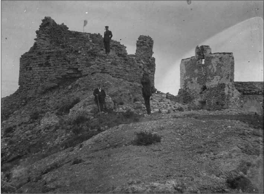
Sant Miquel de Montclar. ACBS 1658-F11. Pontils. 1918.

Magí que parla de les festes, tenim constància avui dia de l'existència d'un ermità dalt del Montclar. I la feina d'aquest ermità d'anar a Sant Magí a recollir les ampolletes per anar a buscar els