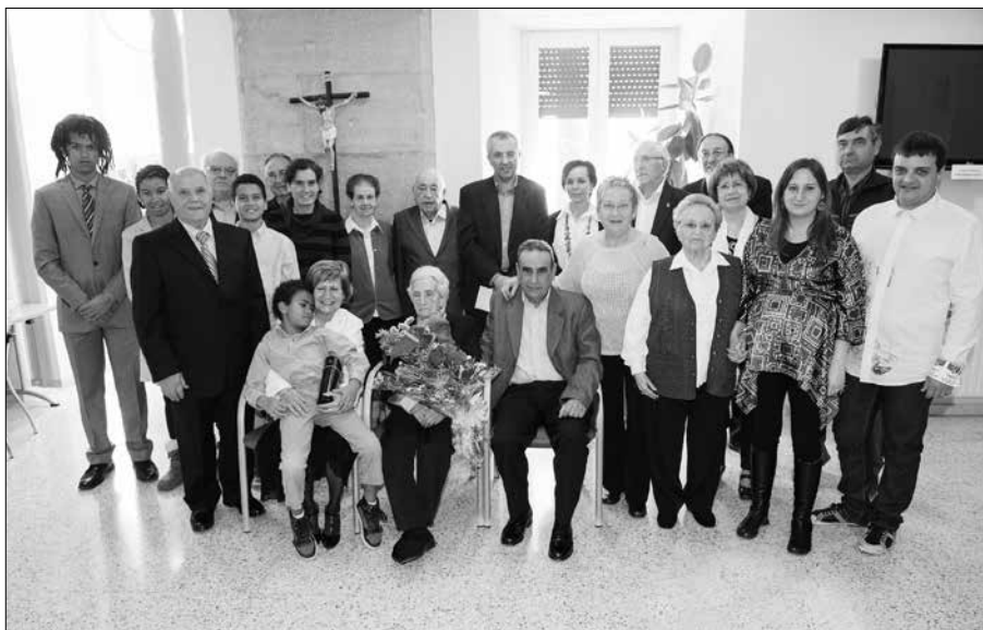
Celebració del Centenari.