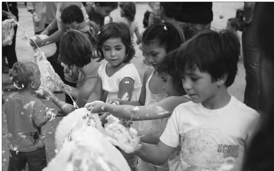
Els còssos.