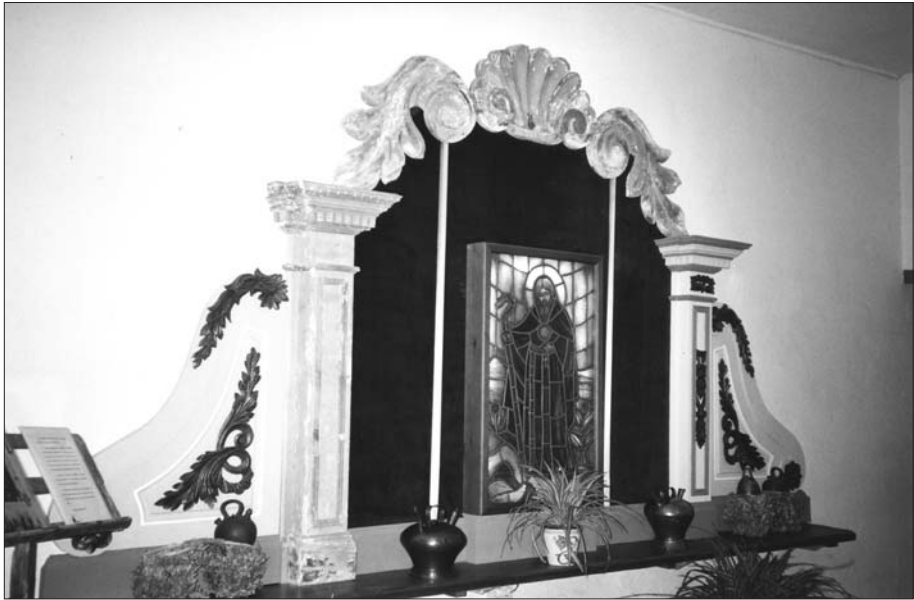
Retaule.