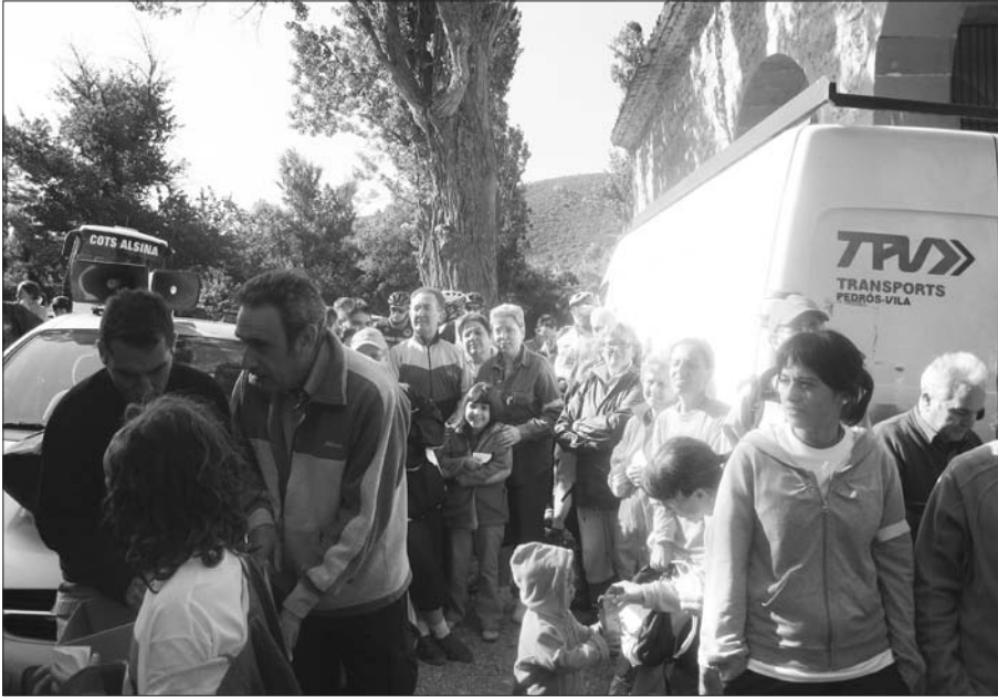
Sorteig.