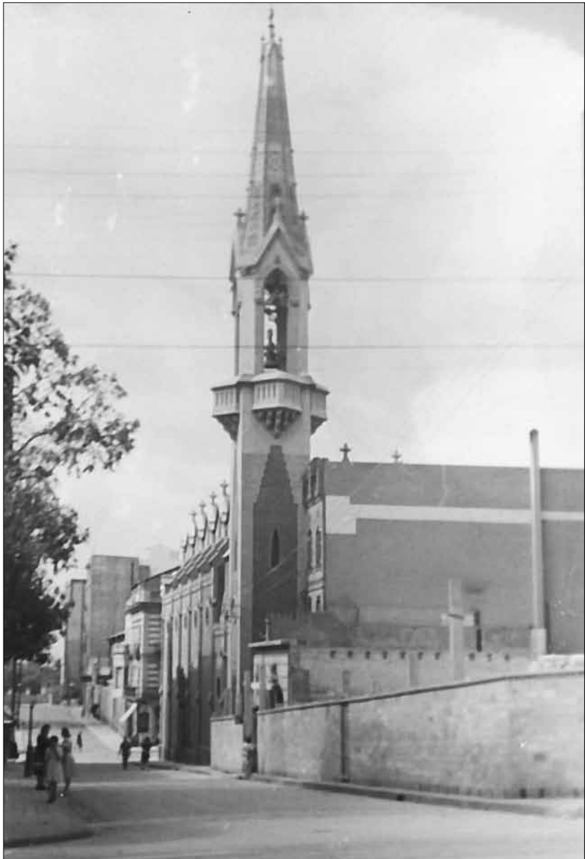
Campanar del Convent dels Franciscans a Barcelona, obra de l'arquitecte August Font i Carreras (1846 – 1924)