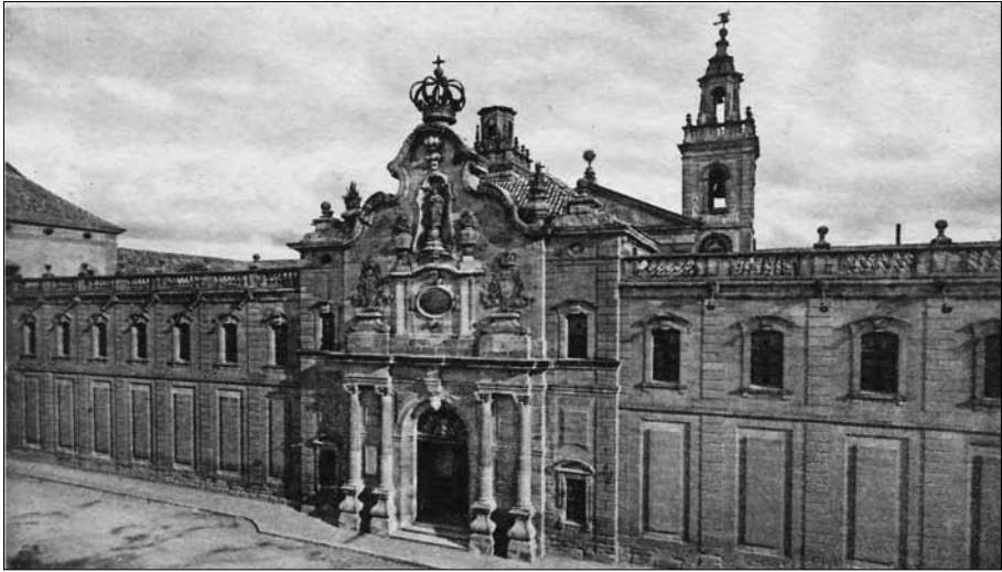
Universitat de Cervera

Miquel Àngel, d'un Leonardo da Vinci, d'un Quixot, de la Bíblia, d'un llibre com "El Criteri", es toca quelcom que és especialment gran i extraordinari.