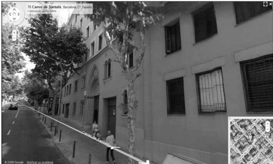
Imatge obtinguda per mitjà de l'StreetView de Google Maps [Consulta: juliol 2011]