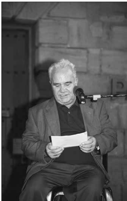
El Miquel llegint el pregó.

Recordo que amb l'Eduard de cal Caragol, baixàvem del Santuari cap a les fonts passant per uns senderols de la muntanya per on, segons la llegenda, els