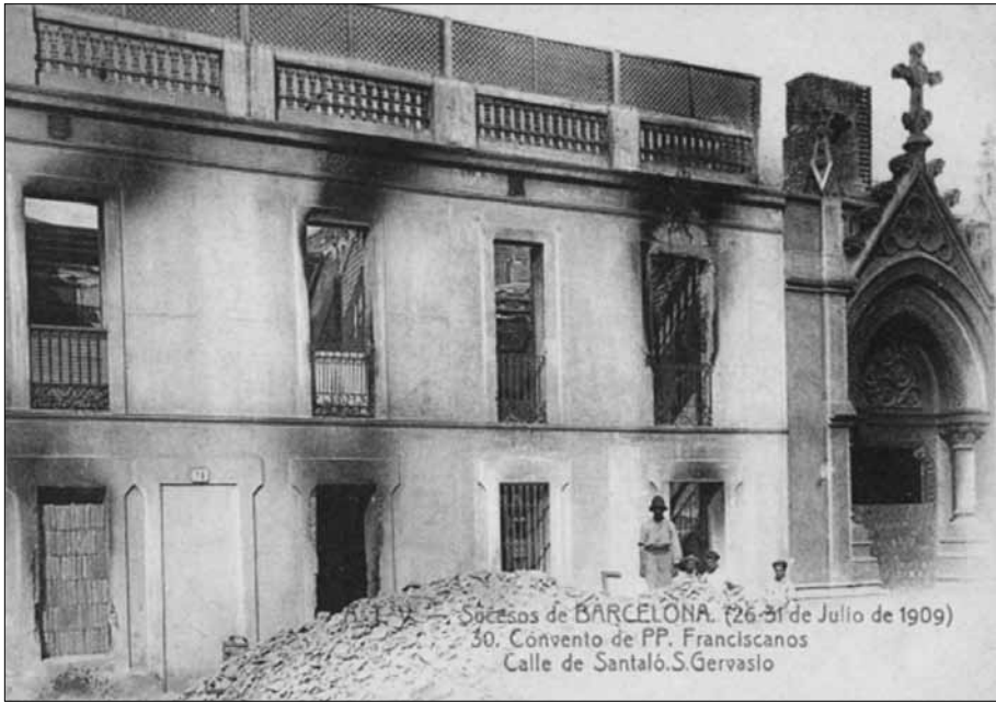
Església de Sant Magí i Convent dels Franciscans a Barcelona (1909)