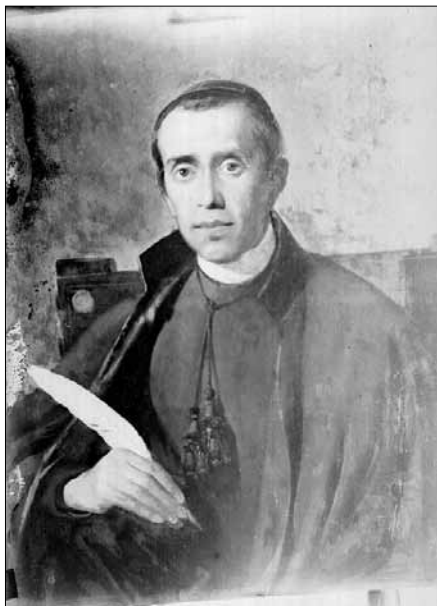
Retrat de Jaume Balmes

També en Balmes veiem una gran valoració de la pròpia personalitat. Nombrosos fets de la seva vida així ho indiquen. Així, per exemple, els fets que segueixen. Deia Balmes que si ell hagués llegit tant com els altres, seria tant “tonto” com els altres. Per això, encara que havia llegit molt, volia llegir poc i pensar molt. Balmes s’adonava que l’home és quelcom més que un devorador de fulls de llibre o un que s’alimenta de paper. Creia que s’havia de pujar a un pla més personal. Ell volia ser més aviat una persona dotada d’originalitat a l’hora de pensar, que no pas reduir-se a ser un repetidor de coses que diuen els altres. Volia ser un productor i un investigador, més que reduir-se a conservar el que d’altres havien arribat a saber. Volia tenir un estil propi, una firma pròpia. Abans de llegir un llibre li agradava posar-se davant de l’índex del mateix. Així intentava desenvolupar el contingut del llibre abans de llegir-lo. Després, en llegir-lo, mirava si l’autor el desenvolupava com ell ho hauria fet. És un mètode que segueixen els matemàtics: no s’arriba a aprendre matemàtiques llegint les demostracions, sinó deduint per un mateix el teorema, fent una demostració personal, fent que el teorema sigui com un fill del propi raonament, engendrat pel propi pensament. Tothom sap que Balmes, pensant, havia arribat a resultats importants. Amb tot, fins i tot si quan un arriba a pensar no descobreix resultats especialment importants, és llavors quan