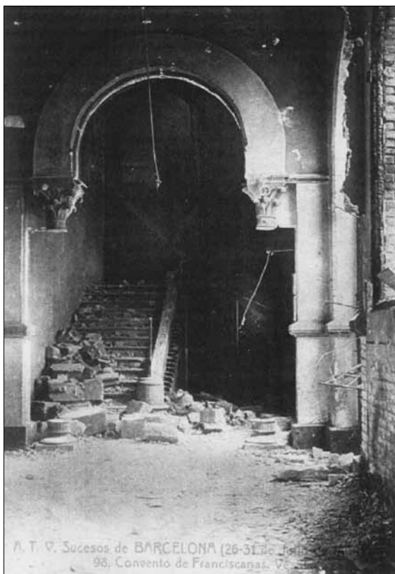
Entrada del Convent del Franciscans a Barcelona (1909)