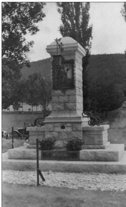
El Pedrò d'Igalada a Sant Magí de la Brufaganya.

Els dies 26 i 27 de juny es va celebrar el 4rt. Aplec de la Capelleta de Sant Magí