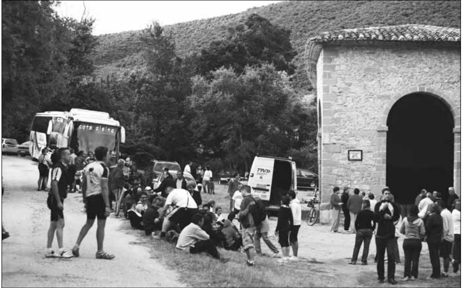
Participants de la XIX Marxa a la Brufaganya.

El camió per a portar els feixos de boix, les garrafes d'aigua, les bicicletes, etc., ha estat el de Transports Pedrós Vila.