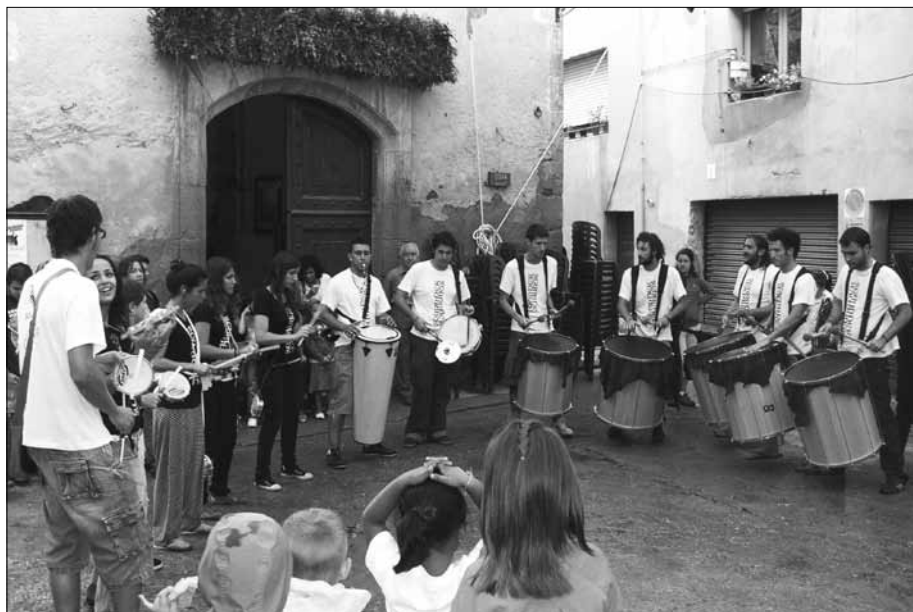
El grup de percussió Sound de Secà.

engalanada la resta de repartiment, que ha acabat a quarts de dues a la placeta de Sant Magí. M'ha fet trist veure que la canalla estaven preparats per tornar a pujar al carro, però les circumstàncies manen, i degut a la caiguda de la mula, no ens podíem arriscar.