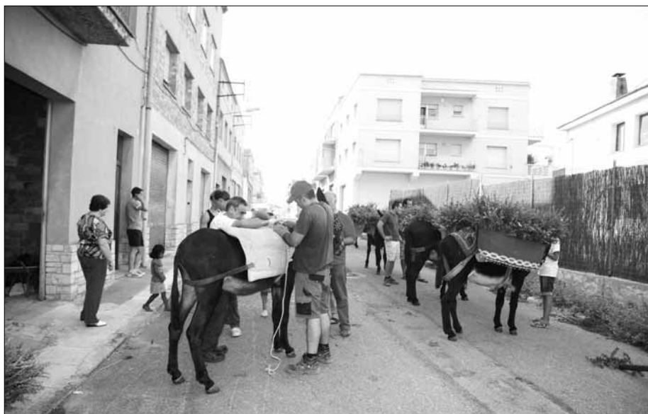
Guarnint les càrregues.

En arribar a la Placeta de l'Estació, els portants hem estat obsequiats per