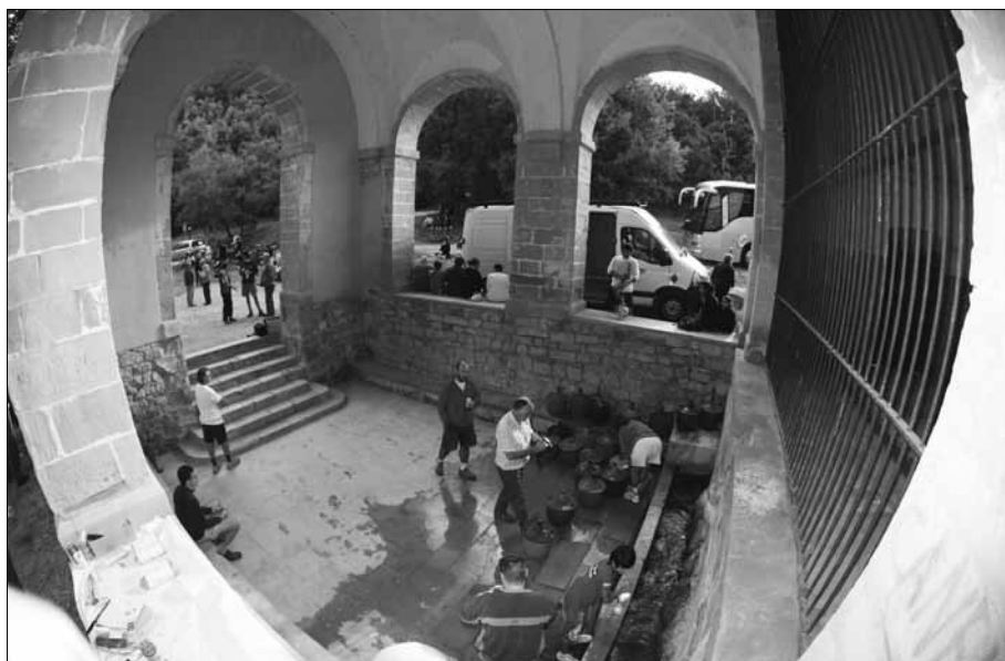
Omplint les garrafes d'Aigua.

per Josep M. Eroles i acompanyat del Jordi Vicente. Duen menjar, aigua, una farmaciola, obsequi d'Asepeyo i eines específiques per bicicleta, facilitades per Esports Truga.