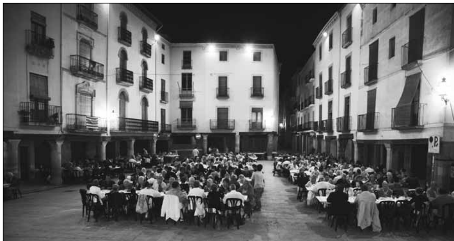
Sopar de Sant Magí.