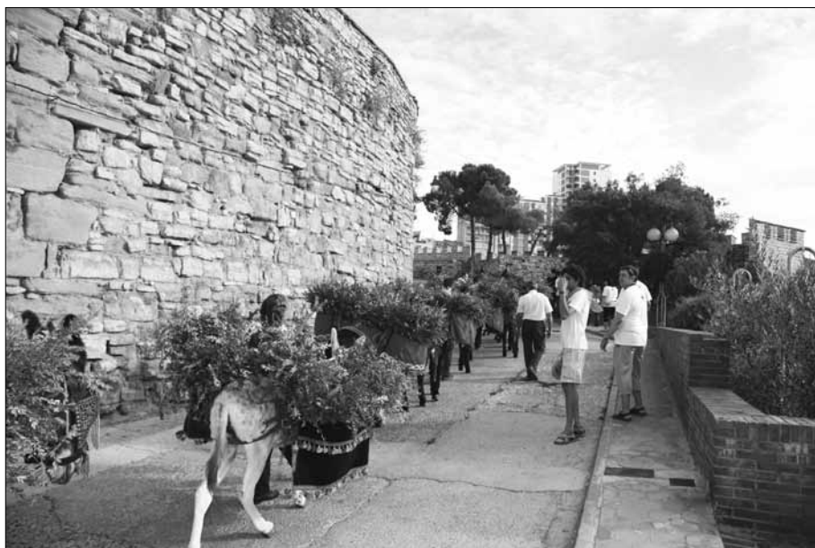
Repartiment de l'Aigua. Pujant per la Barbacana.

preparant, tot seguit, la Capella i la Placeta per a la concorreguda Missa de les 7.