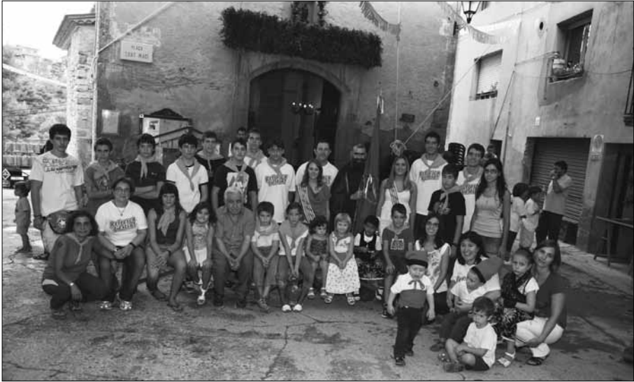
El grup de repartidors de l'Aigua.

passar mai més! Per un paper, ningú m'ha de renyar!