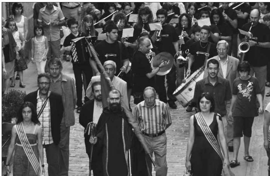
Comitiva de l'Entrada de l'Aigua.

part de l'Associació amb: una mida del Sant per posar al bridó, una botella del cava, una capsa de galetes i un número pel sorteig d'un pernil. A la llista hi cal afegir els dos tiquets per l'esmorzar de la Brufaganya i un pel sopar de Sant Magí a la plaça Major.