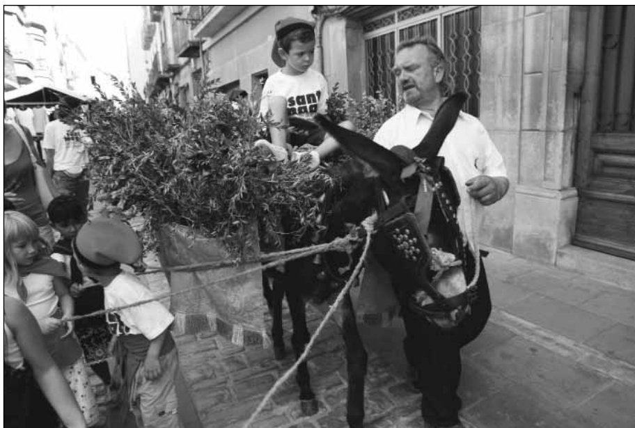
Una càrrega molt ben menada.

Repartiment de l' Aigua. La Sílvia, l'Imma i el Xavier organitzen els repartidors que acompanyen la comitiva amb el mateix ordre de l'Entrada de l' Aigua, però sense les autoritats.