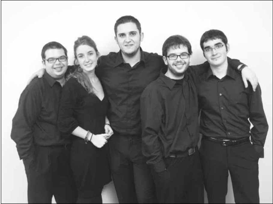
DaCap, quintet de vent.

assistents amb un petit refrigeri a l'esplanada que hi ha davant del santuari. Durant una estona, a la fresca de la nit, es comenta amigablement l'acte al que acaben d'assistir i fins i tot es pot parlar amb els intèrprets o músics. La xocolata desfeta ben