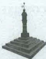
Dibuix: Alba Vilató i Solé