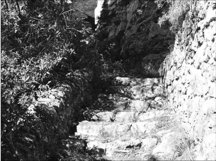
Escala d'accès a les coves.

A dalt al monestir de St. Magí hi pujava molta gent, molts devien tenir ben poca cosa, alguns potser res, però n'hi havia que eren solvents econòmicament, i també hi pujava gent rica. Potser el Francisco ajudava a moure's pel monestir als que acabaven d'arribar, potser els portava a l'ermita i a la cova, o els ajudava si necessitaven res, o els cuidava si es posaven malalts. Potser els que pujaven, que a vegades es quedaven