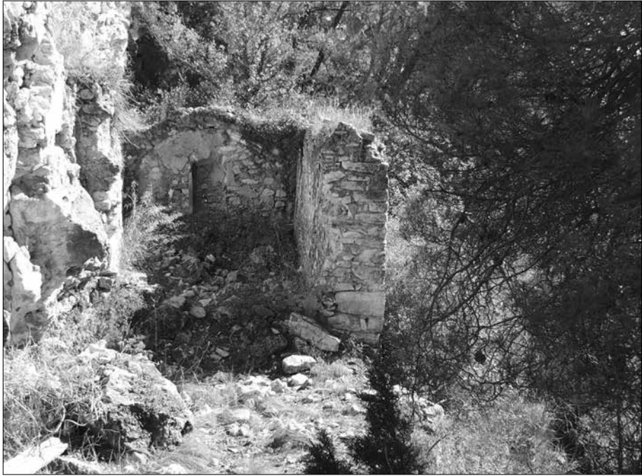
Estat actual de l'Ermita.