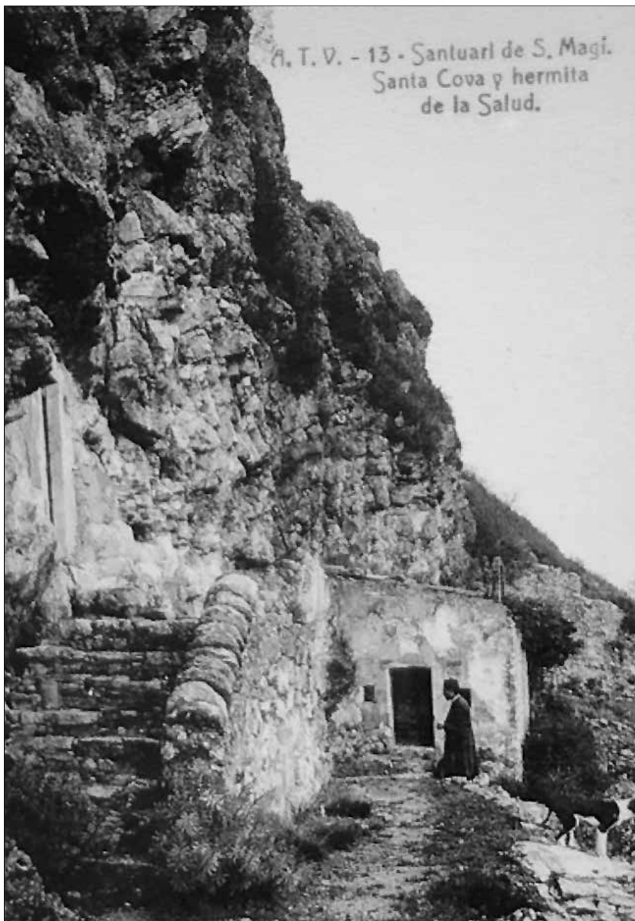
Postal d'Àngel Toldrà Viazo.